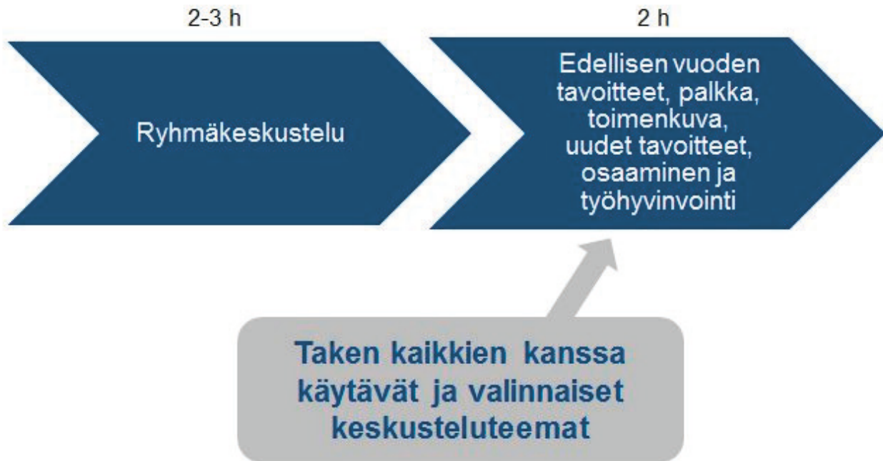
Kuva 2. Vaihtoehto 1