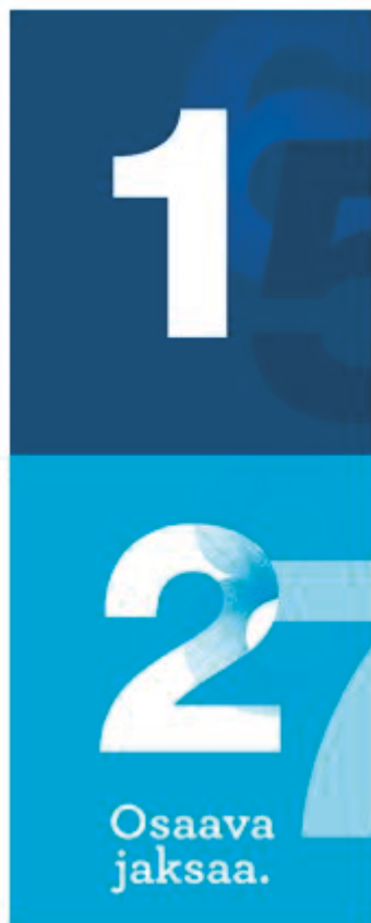
Kuva 1. Tavoite- ja kehityskeskustelun keskusteluteemat

Tavoite- ja kehityskeskustelu koostuu kaikkien kanssa käytävistä ja valinnaisista keskusteluteemoista (kuva 1). Henkilökohtaisessa tavoite- ja kehityskeskustelussa kaikkien kanssa käytäviä osioita ovat edellisen vuoden arviointi sekä perustehtävän ja tavoitteiden tarkistus. Näiden lisäksi työntekijä ja esimies valitsevat keskusteluun muita teemoja. Kaikki valinnaiset keskusteluteemat liittyvät eri näkökulmista joko työhyvinvointiin tai osaamisen kehittämiseen. Teemat on kuvattu tarkemmin keskustelun tukena olevissa kysymyskortteissa. Valinnaisia teemoja suositellaan valittavaksi yhteensä noin kolme kappaletta.