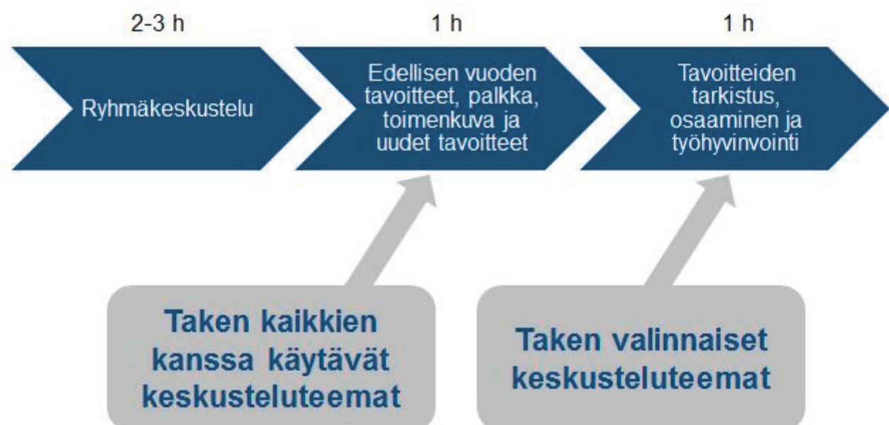
Kuva 3. Vaihtoehto 2

Ensimmäisessä keskustelussa keskusteltaisiin tässä vaihtoehdossa edellisen vuoden tavoitteista, toimenkuvasta, palkasta ja uusista tavoitteista. Myöhemmin pidettäisiin erillinen keskustelu, jossa tarkistetaan uudet tavoitteet ja keskustellaan nykyisistä tavoite- ja kehityskeskustelun valinnoista keskusteluteemoista, jotka liittyvät työhyvinvointiin ja osaamiseen.